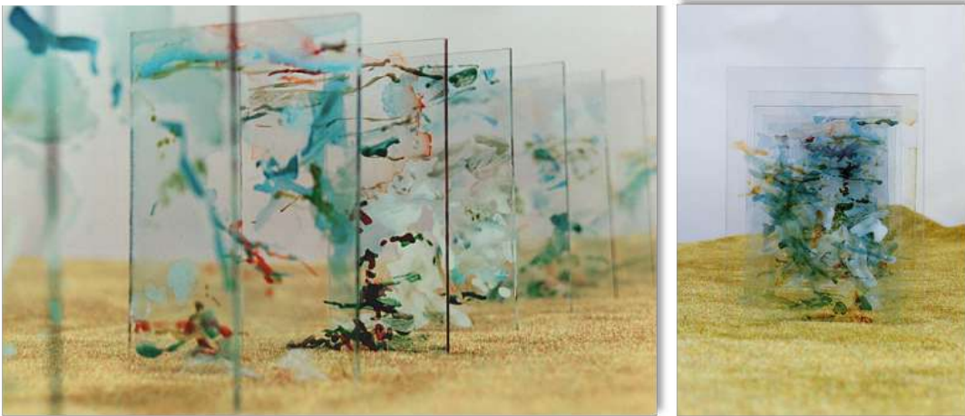
A ciel ouvert - Corinne Albrecht

Ces surfaces sont donc aussi des toiles peintes, des tableaux qui se fabriquent et sont peints au plateau pendant le spectacle par les comédiennes. Le geste de construction, de fabrication organique, visible au plateau m'intéresse particulièrement dans ce projet car il est synonyme de l'utopie d'un monde en devenir. Les personnages inventent leur décor, leur monde et leur corps plein d'énergie est investi dans ce projet. Les comédiennes sont donc aussi performeuses et la scène un espace théâtral mais aussi plastique proche de l'expérimentation de Land Art, discipline de laquelle nous nous inspirons beaucoup pour la conception de cette scénographie et en particulier du travail de la plasticienne Ana Mendieta.